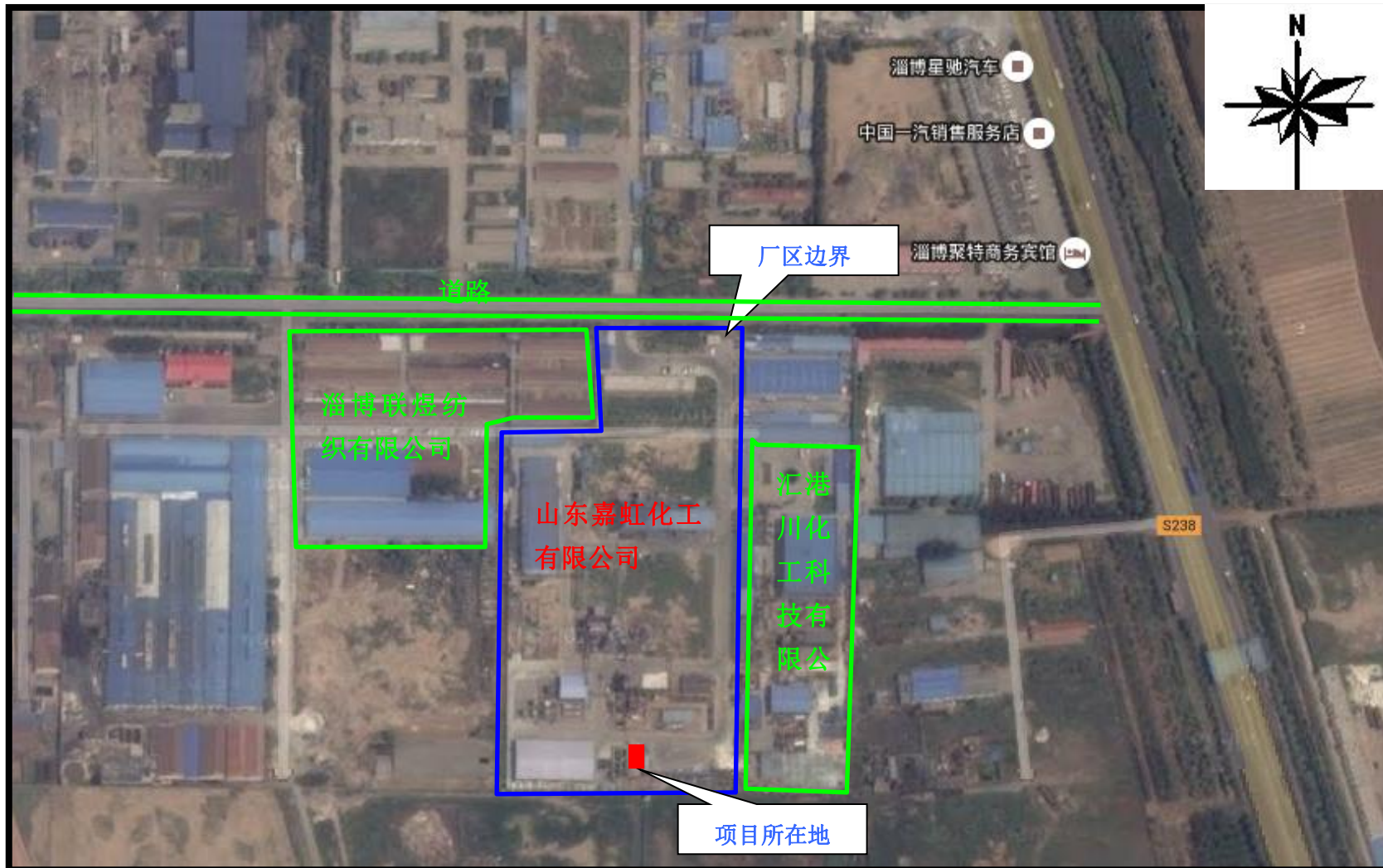
图 3-2 项目周边关系图 比例尺 1: 5000